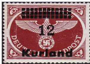
Kurland, zegels nrs. 1 en 4

In de periode van 1905 tot 1914 bestond daar de Baltische Constitutionele Partij (BKP). Maar zoals overal gebeurt werden ook andere politieke partijen opgericht. Om meer nieuwe leden te krijgen wendde men zich tot de rijkere klasse. Daar was ook het meeste geld te vinden. Maar hoe kom je dan aan voldoende geld in kas? Heel simpel, probeer het met de uitgifte van zegeltjes. In dit geval werden op postzegels lijkende zegels uitgegeven met daarop gedrukt: Partei Beitrag , en de diagonale opdruk: Kurland .