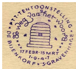
Het speciale stempel van de tentoonstelling