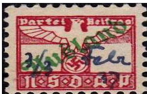
Het zegeltje met de vraag om een bijdrage

In de periode van 1905 tot 1914 bestond daar de Baltische Constitutionele Partij (BKP). Maar zoals overal gebeurt werden ook andere politieke partijen opgericht. Om meer nieuwe leden te krijgen wendde men zich tot de rijkere klasse. Daar was ook het meeste geld te vinden. Maar hoe kom je dan aan voldoende geld in kas? Heel simpel, probeer het met de uitgifte van zegeltjes. In dit geval werden op postzegels lijkende zegels uitgegeven met daarop gedrukt: Partei Beitrag , en de diagonale opdruk: Kurland .