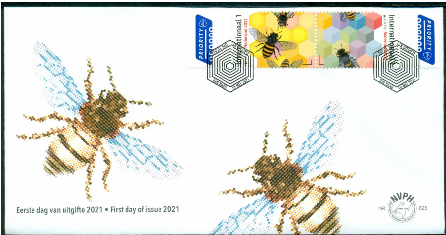
Envelop E 825 uit 2021

Enkele weken voor de uitgifte kreeg de vereniging de FDC's met de bijbehorende zegels toegezonden. Jaap plakte de benodigde zegel(s) op de enveloppen en verzond die daarna in een speciale doos naar de Filatelistische Dienst waar de enveloppen vervolgens werden afgestempeld. Daarna kreeg elke vereniging het benodigde aantal gestempelde enveloppen terug om die aan de leden/verzamelaars te verkopen, of uit te leveren via hun abonnement. Toen de Filatelistische Dienst verhuisde naar Groningen werd het voor Jaap een stuk gemakkelijker. De dienst vestigde zich in een gebouw naast het kantoor waar Jaap toen nog werkte. Hij kon toen tussen de middag even naar de "buren" lopen en daar het materiaal overhandigen.