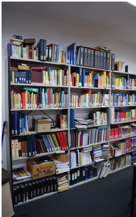
Het gedeelte van de bibliotheek met de catalogi enz.

Ook de hoeveelheid catalogi is fors uitgebreid. Sommige moeten nog opnieuw worden ingedeeld. We blijven actief.