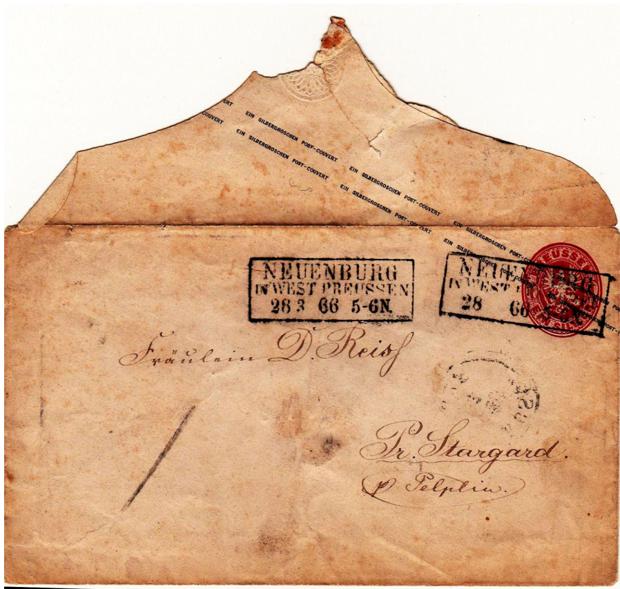
De complete envelop met open klep

In Pruisen en Hamburg werden deze enveloppen eerst diagonaal afgestempeld over zowel de envelop als de postzegel waarna een brief of iets anders in de envelop werd gestopt. Vervolgens werd de envelop dichtgeplakt en verzonden.