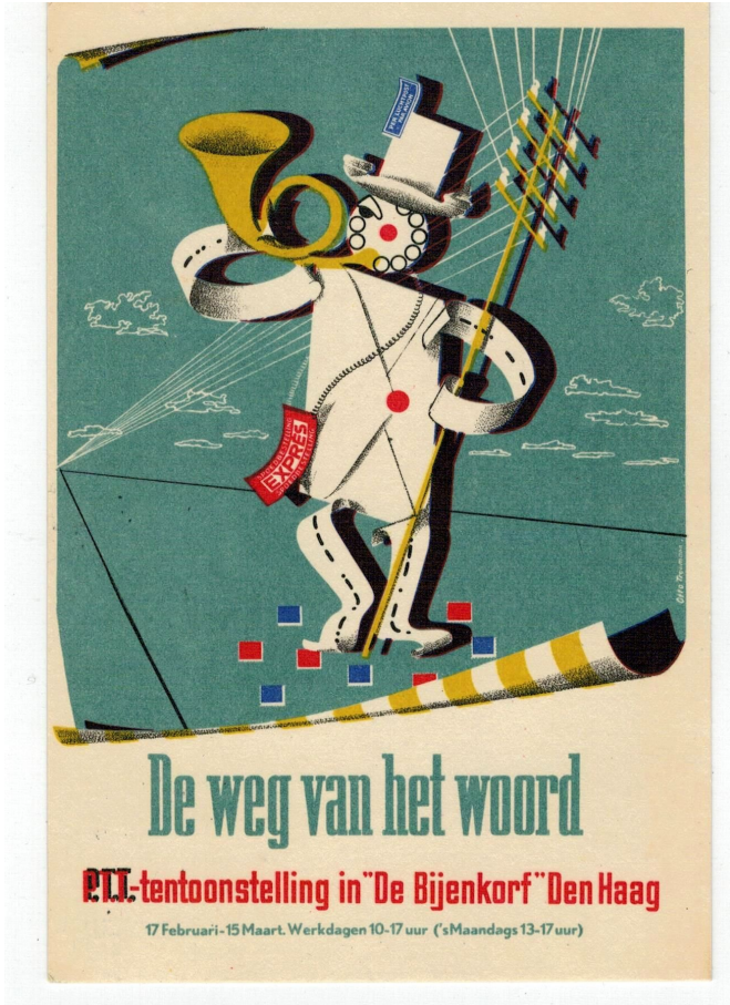
Voorzijde van de kaart

Een van de vele vormen van communicatie die de PTT verzorgde was “De weg van het woord” een propagandatentoonstelling van de PTT. Deze werd gehouden van 17 februari tot 15 maart 1947. Ter gelegenheid van deze tentoonstelling werd door de PTT ook een kaart uitgegeven.