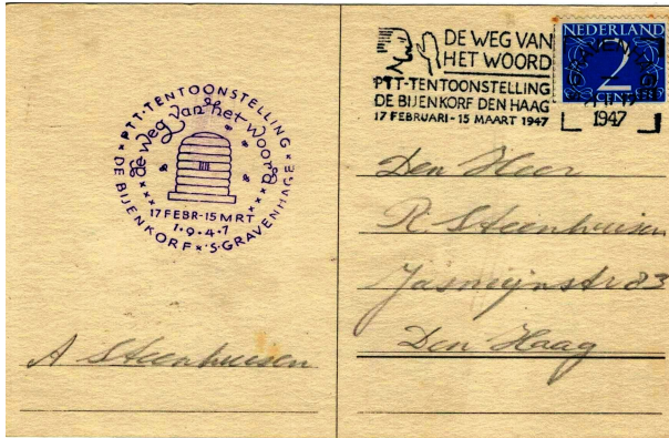
achterzijde van de kaart

Het stempel met de bijenkorf is heel bekend en staat symbool voor de drukke werkzaamheden van de PTT: een ijverig volkje die jongens van zowel post, telefoon en telegraaf.