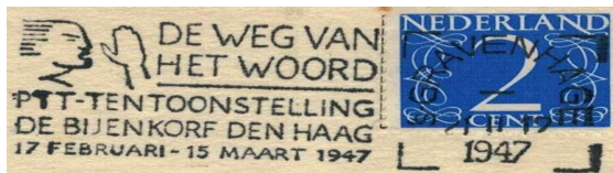
Vlagstempel op de achterzijde van de kaart