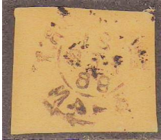
(abklatsch; H. van Dijck)