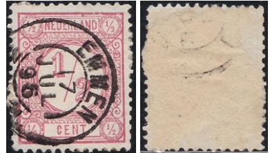
EMMEN (abklatsch; D. v.d. Heide)

We bekijken nu de stempels in de lijst vanaf 3 januari 1891, de dag waarop de krant voor het eerst uitkwam: