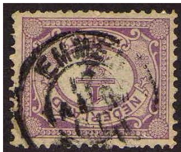
postkantoorstempel, 17 AUG 00 3-4N

Waar is de ander post in dit tijdvak dan mee afgestempeld? Met het grootrondstempel dus (op 12 maart 1896 ontvangen).