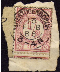
's Hertogenbosch met flapje

Hierbij konden, door "versnijding" flapjes zegel van boven- of onderliggende zegels, of zelfs volledig verminkte zegels (de zogenaamde kruisband- of krantenbandverminking), ontstaan. Hieronder enige voorbeelden ter verduidelijking: