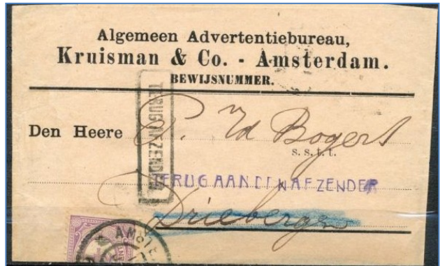
↑ kruisbandverminking (dwars door de zegel)

En niet alleen dat, ook een duidelijk ander kenmerk van voorafstempeling wordt dan zichtbaar, de "abklatsch", ofwel de spiegelafdruk van de natte stempels van het onderliggende, pas gestempelde, vel adresstrookjes of bandjes (de snel, met hamerstempel, gestempelde vellen worden boven op elkaar gelegd en geven zo hun abklatsch aan het bovenliggende vel (behalve bij het eerste vel). Die abklatsch zit dus aan de binnenkant van een later om een periodiek dichtgevouwen bandje.