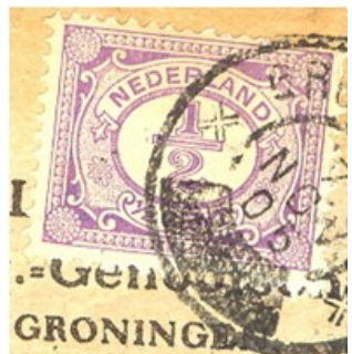
zwart blokje i.p.v. uurkarakter

Verder zijn er nog o.a. de strookafstempeling, POKO-perforatie DT van de Telegraaf, bedrijfsstempels (o.a. bij de NRC) en de nachtreinafstempeling, maar deze vormen van voorafstempeling zijn in Noord-Nederland niet gebruikt.