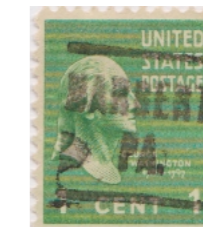
Narberth Pennsylvania L-2HS