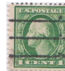
4 lines 6mm Yonkers New York

Uitgebreide beschrijving in catalogus 'Silent Precancels' 1995 (P.S.S. / David W. Smith)