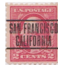
San Francisco California L-3E