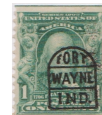
Fort Wayne Indiana L-1E