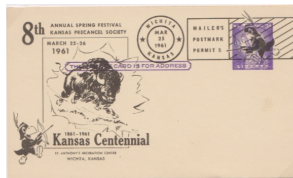
Wichita Kansas, permit 5, 1961

Bij 'Mailers Postmark' krijgt de verzender toestemming zijn postwaardestukken te ontwaarden d.m.v. afstempeling (handafstempeling of druktechniek). De afstempeling moet zijn voorzien van een vergunningnummer (permit)