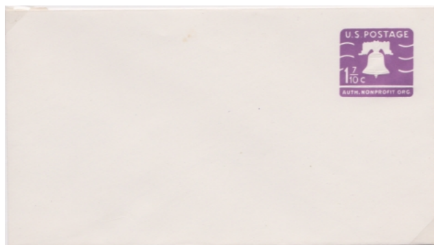
1973 / Sc U 568 Auth. Nonprofit Org.