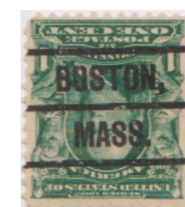
Boston Massachusetts L-4E