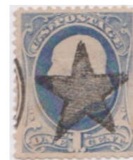
'Ster' Glen Allen Virginia

Voorafstempeling door middel van Lines (printed/pen/pencil/brush) Bar and Designs. Voor het identificeren van de 'lines' is het van belang dat de zegel zich nog op het poststuk bevindt. Bekendste stempels: Glen Allen Va (vijfpuntige ster), Chicago III (C in ovaal), New York (NY in parelring) en Glastonbury Conn. (G.)