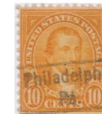
Philadelphia Pennsylvania L-13HS