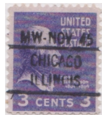
Chicago Ill. L - 52IHS (MW - NOV45)

IHS = Integral Hand Stamp ITS = Integral Type Set