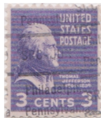
Philadelphia Pa. L - 35 IHS (SRC-JUN)